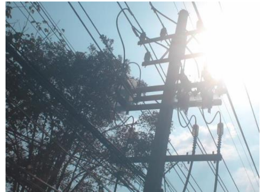
Visible Light Image